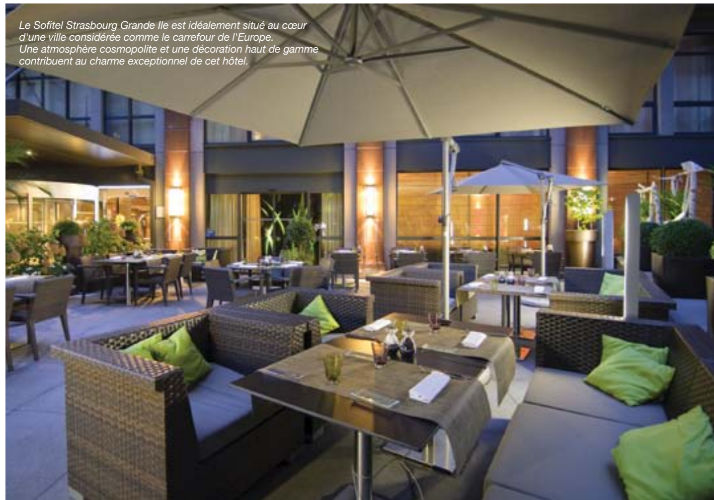
Le Sofitel Strasbourg Grande Ile est idéalement situé au cœur d'une ville considérée comme le carrefour de l'Europe. Une atmosphère cosmopolite et une décoration haut de gamme contribuent au charme exceptionnel de cet hôtel.