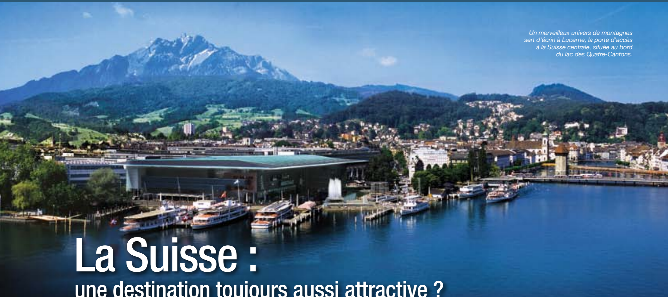
Un merveilleux univers de montagnes sert d'écrin à Lucerne, la porte d'accès à la Suisse centrale, située au bord du lac des Quatre-Cantons.