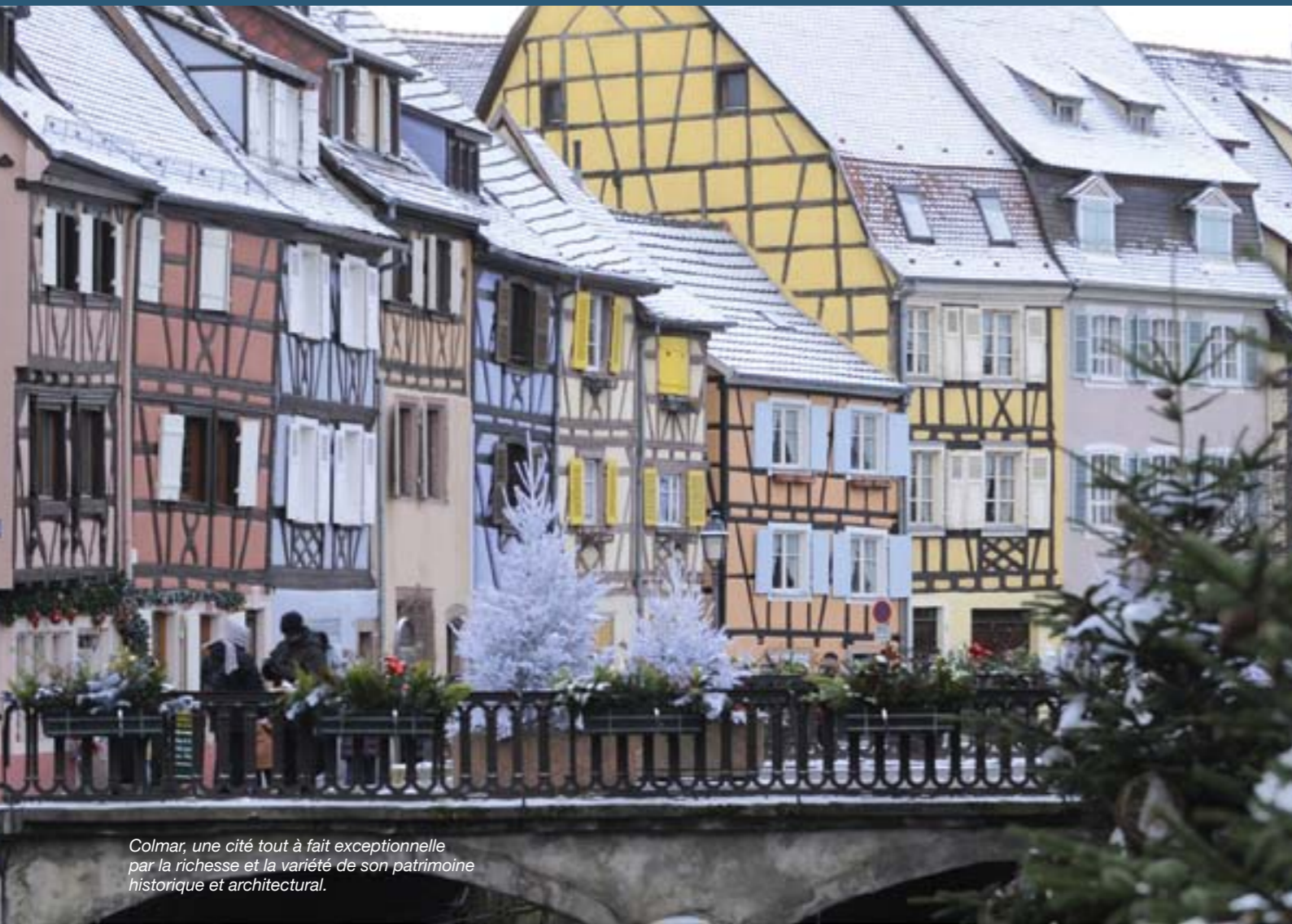
Colmar, une cité tout à fait exceptionnelle par la richesse et la variété de son patrimoine historique et architectural.